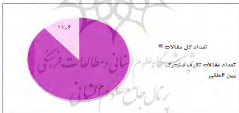
نمودار ۲: نسبت تعداد مقالات با همکاری بین‌المللی نسبت به کل مقالات

تألیف مشترک نیز صادق است. مقالات تألیف مشترک بین‌المللی (۲۲ عدد) در سال ۲۰۰۷ میلادی کاهش داشته است، در حالی که تعداد کل مقالات در این سال کاهش نداشته است. نمودار هم‌چنین نشان می‌دهد که در سال ۲۰۱۱ میلادی، تعداد کل مقالات (۵۰۳ عدد) و تعداد مقالات تألیف مشترک بین‌المللی (۵۵ عدد) کاهش یافته‌اند.