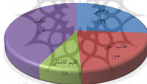
نمودار ۳: فاصله افتادن میان حرف نفی با فعل

۴-۲-۴ جدایی ضمائر متصل مفعولی و متممی از فعل و اتصال آنها به حرف، تکواژهای وجهی، صفت، ضمیر، قید و اسم نکره