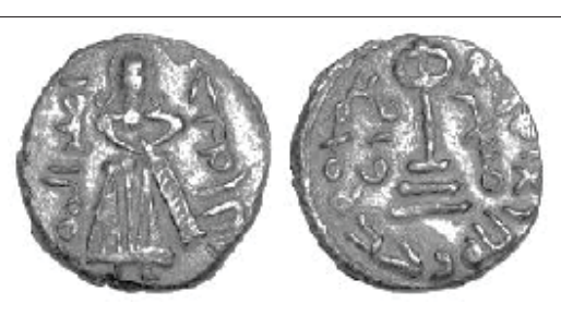
شکل (۸): فلس اسلامی بیزانسی

قسمت روی سکه: تصویری مشابه عبدالملک بن مروان قرار دارد که درکنار آن عبارت «لِعبدِالله عَبدِالمَلك أميرَ المؤمنين» نوشته شده است.