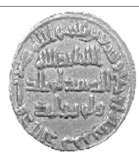
شكل (٤): دينار خالص اسلامي

قسمت روی سکه: در مرکز، عبارت «الله اَحَد الله الصَمَد لَم يَلِد ولَم يولَد» نوشته شد. تاريخ ضرب نيز بهصورت عبارت «بِسم الله صُربِ هذا الدينار في سَنه سَبع و سَبعين» آمده است.