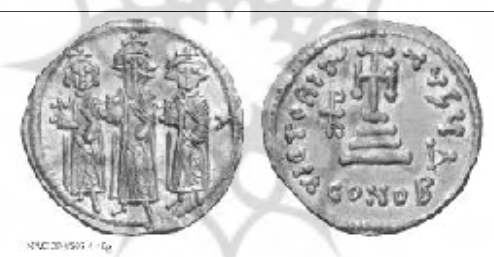
شکل (۱): دینار بیزانسی

عبدالملک بن مروان در ضرب مسکوکات دینار جدید، از الگوی دینار بیزانسی استفاده نمود. (شکل ۱) این دینار دارای اوصاف زیر است: ۲